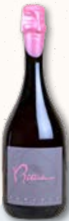
023334 VERJULY ZWIEGELT ALKOHOLFREI erfrischend, fruchtig & mit Kohlensäure versetzt Rittsteuer 750 ml