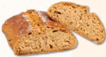
023333 CIABATTA MEDITERRAN Mauracher 320 g