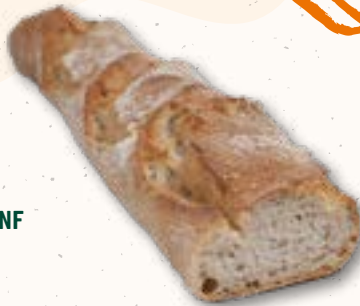
002704 BAGUETTE HELL WEIZEN Mauracher 320 g

ALLES FÜRS GRILLEN: www.biohof.at/grillangebot