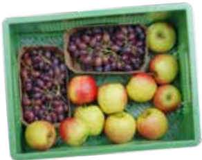
Obstkiste Vielfältige Vitaminbomben