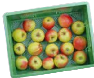
Apfelbox Knackige Klassiker