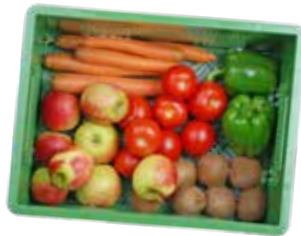
Obst- & Gemüsebox Abwechslungsreiche Auswahl